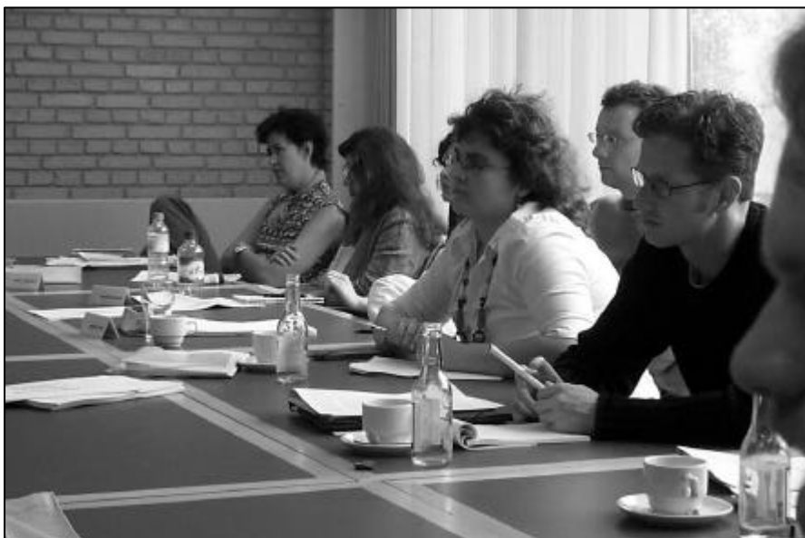
Fat dig i korthed. Det var et af kravene til de ph.d.-studerende på seminaret, der højst måtte bruge tyve minutter på at fortælle om deres eget ph.d.-projekt.