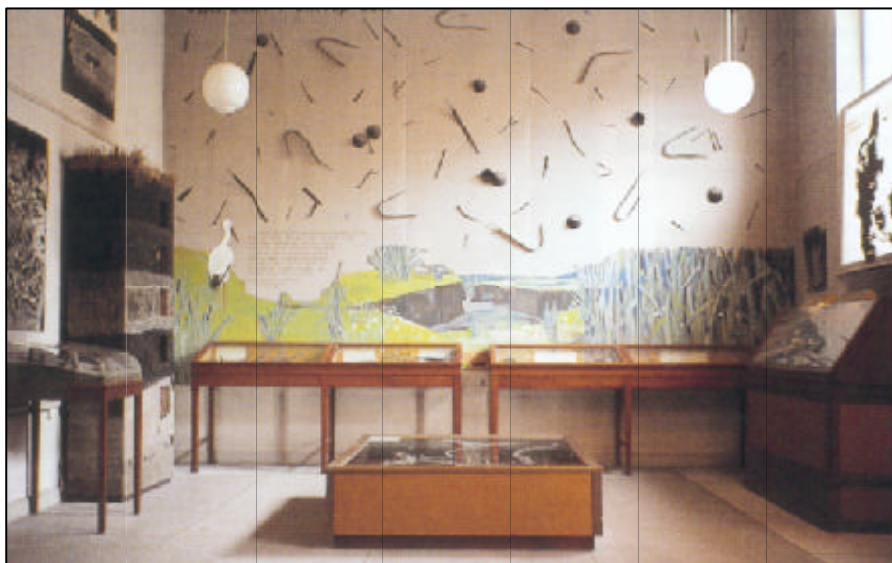
En ny udstillingsform, her af fund fra Illerup Ådal, lanceret i Århus i 1955.