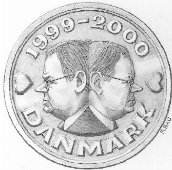
Illustration: Flemming Bau. Gengivet med kunstnerens tilladelse. Illustrationen har tidligere været anvendt i SFINX.

Må jeg foreslå, at vi indleder Folketingets arbejder med at udbringe et leve for Danmark: Danmark leve!