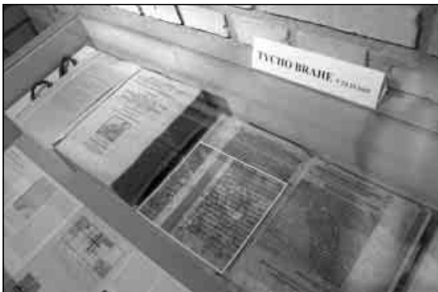
Tycho Brahes egne bøger, trykt på hans eget papir og med synlige vandmærker, udstillet i Statsbibliotekets foyer.