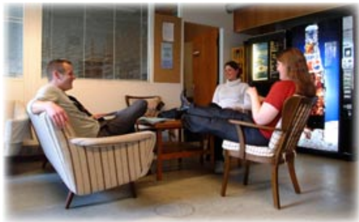
Kolde sodavand, varm kaffe og socialt samvær. Historie har investeret 10.000 kr. i et studenterrum.

at instituttet flyttede sidste år. Først nu er det dog ved at være færdigindrettet så man kan købe en kop kaffe eller en sodavand i automaten, sætte sig i en af de magelige stole og tage et kig på de grønne planter i rummet.