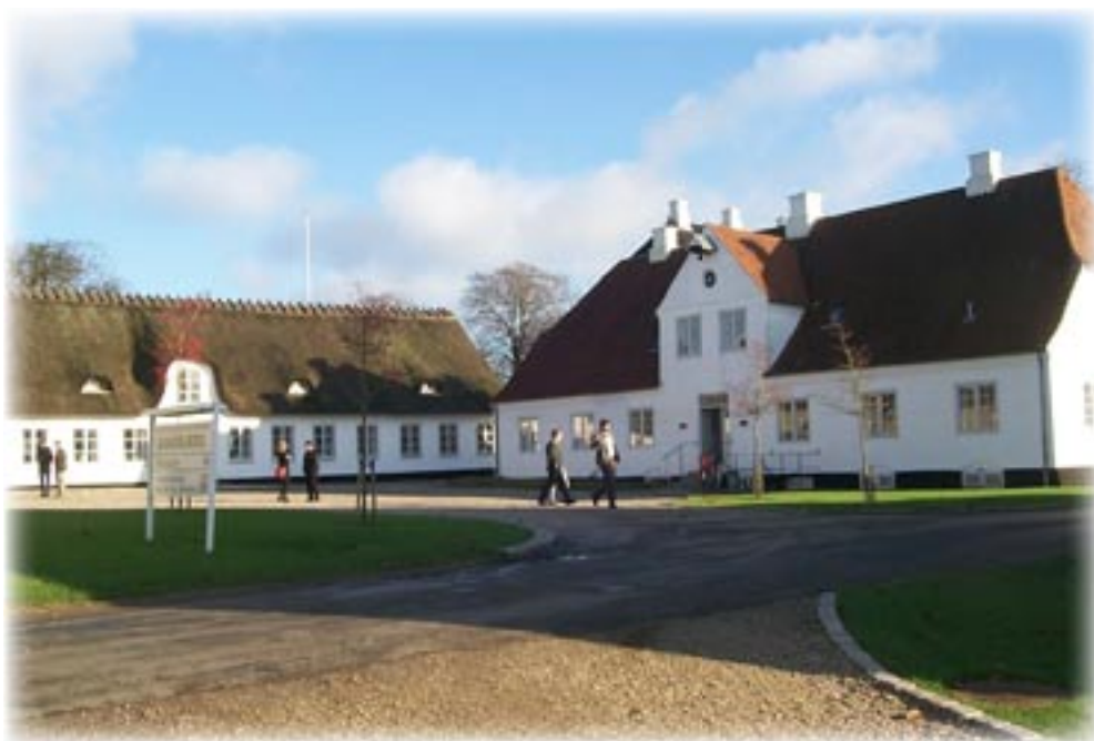
De spøjte på Sandbjerg Slot, men der var alvor bag skæmten da det nye Institut for Historie og Områdestudier blev forsøstret i august.

Eftermiddagen gik så med syv på forhånd af deltagerne foreslåede og valgte workshops om fx kønsperspektiver, komparation, kulturmøder, det 20. århundrede og instituttet om 10 år med påfølgende plenum. Her kom entusiasmen for alvor op til overfladen, og resultatet blev et hav af forslag til forskningsmæssige, undervisningsmæssige og organisatoriske tiltag på tværs af de gamle grænser.