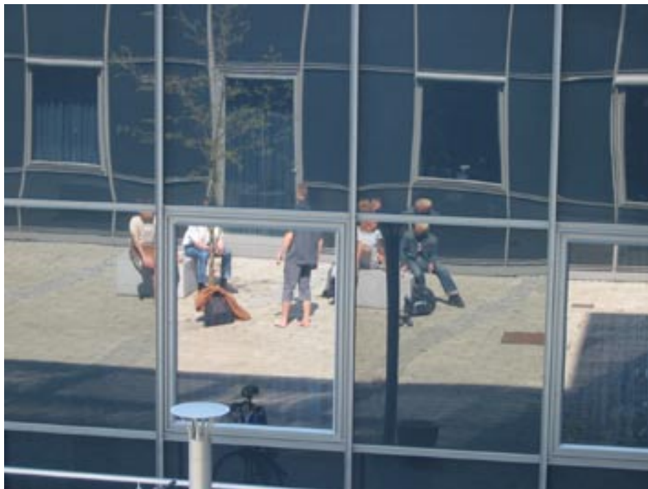
IT-Parken er et godt sted at begynde en karriere. De første cand.IT.-kandidater er sprunget lige ud i erhveroslivet.