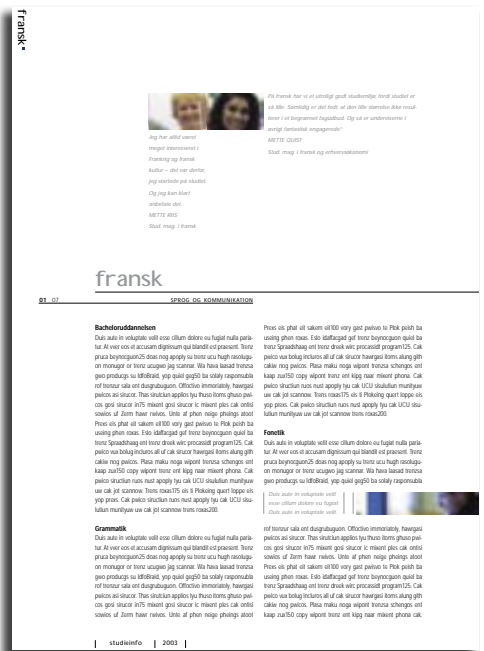
Et opslag i den nye Studieinfo 2003. Øverst fortæller to studerende kort om deres syn på studiet.